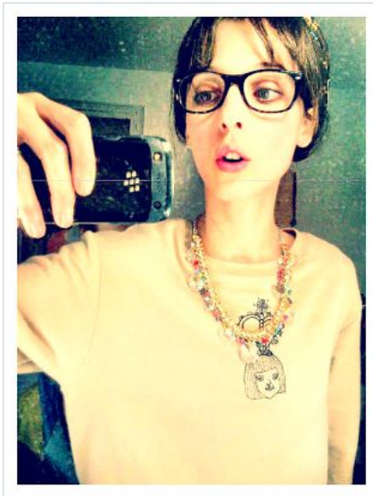
Autofoto realizada por Leticia Dolera para Belleza en Vena

Leticia Dolera no para y aunque la mayoría la conocemos por sus trabajos como actriz, esta catalana también se ha puesto detrás de las cámaras. Ya ha rodado dos cortometrajes, por uno de ellos, " Lo siento, te quiero ", se alzó con el premio al mejor cortometraje fantástico en la convención Fantastic Fest en 2010. Si todo marcha como parece, el próximo año rodará " Requisitos para ser una persona normal ", su primer largometraje como directora. Entre tanto podremos verla en " Kamikaze ", que se estrenará en el primer trimestre de 2014, junto a Carmen Machi , Verónica Echegui y Álex García . Por las mismas fechas comenzará a emitirse la segunda temporada de " Bloguera en construcción ", una webserie escrita y protagonizada por ella para la revista Grazia . Aquí nos cuenta sus secretos de belleza.