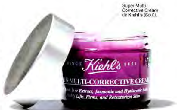
Super Multi-Corrective Cream de Kiehl's (60 €).